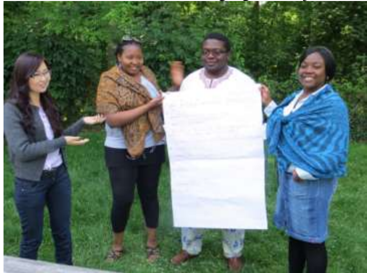
Vorstellung eigener Projektideen.