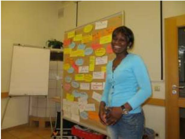
Von der Idee zum Projekt (Brainstorming)