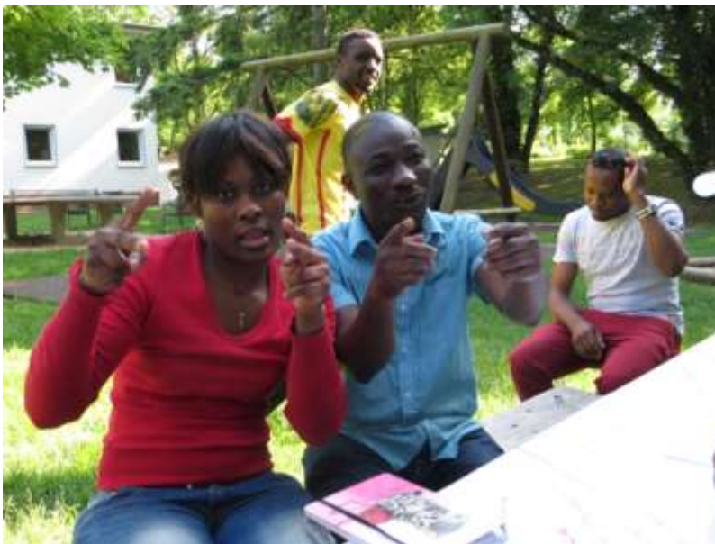
Das ist unser Projekt!!